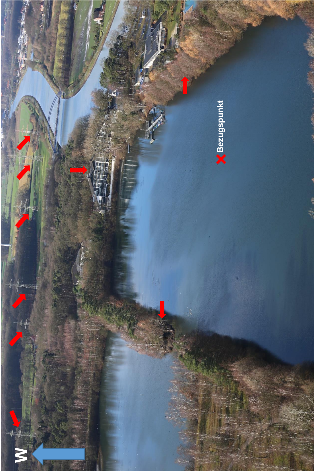
Abbildung 3: Foto aus ca. 50 m Höhe in westliche Richtung auf den Bezugspunkt